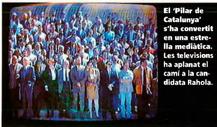
El 'Pilar de Catalunya' s'ha convertit en una estrella mediàtica. Les televisions ha aplanat el camí a la candidata Rahola.

Cap d'ells, de moment, no ha superat aquell Santiago Rusinol que un dia, fent un míting, va prometre fer un pont en un poble on no hi havia riu. Quan els vilatans, amb mostres d'indignació, el van informar de l'error, ell, expert en fugides endavant i en l'art de l'embolica que fa fort, no es va tallar ni un pèl: "Doncs també us farem un riu!"