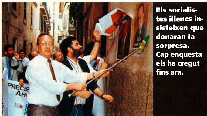
Els socialistes illencs insisteixen que donaran la sorpresa. Cap enquesta els ha cregut fins ara.