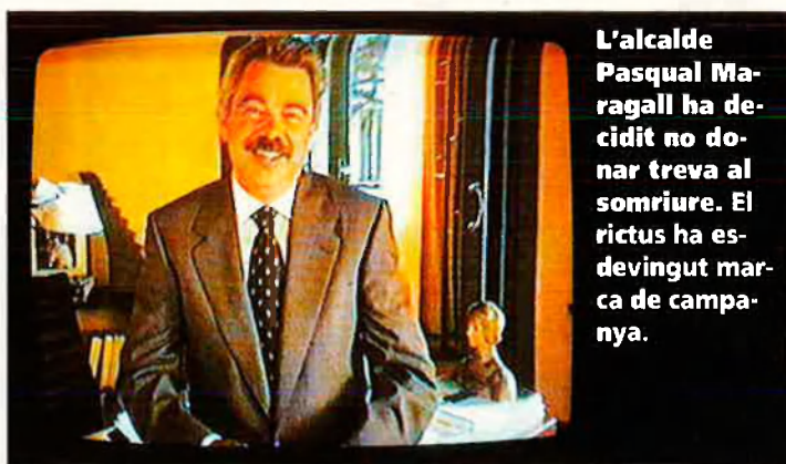
L'alcalde Pasqual Maragall ha decidit no donar treva al somriure. El rictus ha esdevingut marca de campanya.

davant però poca novetat s'augura en el discurs i els mètodes dels polítics valencians. Ni debats ni aparicions en mítings han proporcionat cap sorpresa. Pocs oradors brillants i encara menys debatidors àgils. Repetició i poca discussió sobre programes concrets d'acció política. La televisió, per una vegada, no enganya.