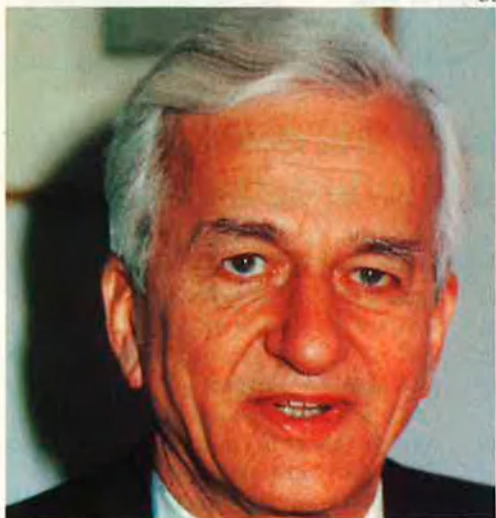
Richard von Weizsacker.

Havel, amb les ulleres fosques de sempre, el clatell militar, la calba perpètuament descambuixada. Fumant com un dimoni, Havel contrasta de forma magnífica amb el posat de l'ex-president de la República Federal d'Alemanya, Richard von Weizsacker, amb els cabells blancs dels estadistes de sempre. President d'un país de deu milions d'habitants, Havel —tot sigui dit— segurament que té temps de dedicar-se tant a l'ètica perquè qui ha governat a la República Txeca és el primer ministre Klaus, un polític efectiu i pragmàtic. Convé que la Unió Europea integri aviat la República Txeca i potser també convé que Alemanya ens lideri una mica més a tots. Per això no va ser gens banal la idea de donar el premi Catalunya d'enguany al txec Václav Havel i a l'alemany Richard von Weizsacker.