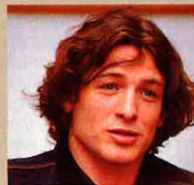
NACHO DUATO Dir. Cia. Nacional Danza