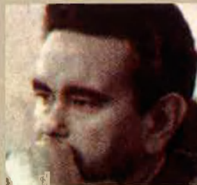
ANDRÉS PEDREÑO Rector U. Alacant