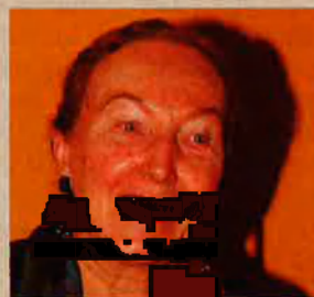
MATILDE SALVADOR Compositora