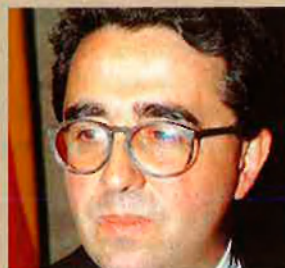
S. CALATRAVA Arquitecte