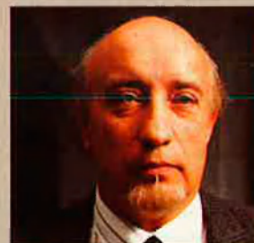
MANUEL VICENT Escriptor