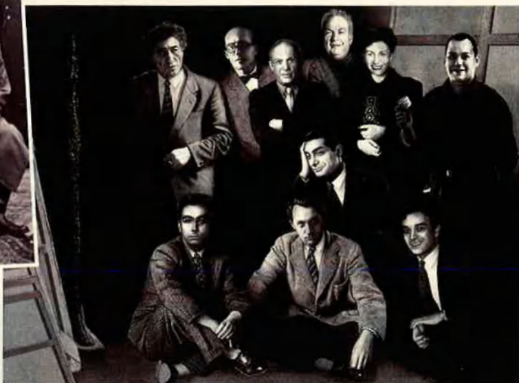
París, cap a 1960. La foto que hauria pogut ser: d'esquerra a a dreta i de dalt a baix, Giacometti, Le Corbueier, Picasso, Calder, Denise Colomb, Manzoni, Capa, Tàpies, Soulages i Klein

EXPOSICIÓ Barcelona 12 de maig - 30 de juliol del 1995