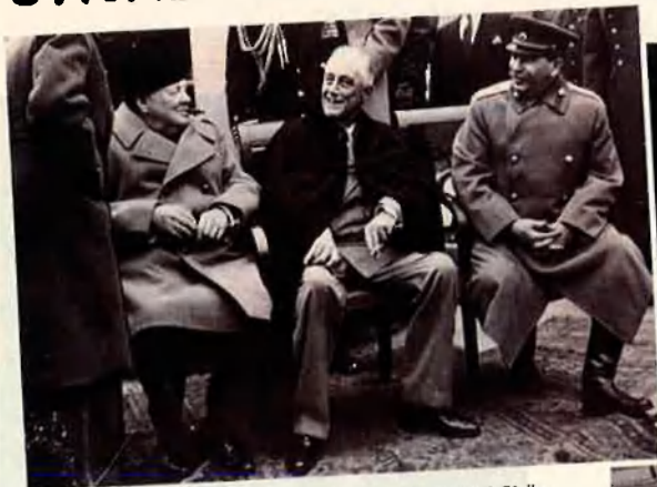
París, 1945. D'esquerra a dreta, W. Churchill, F. D. Roosvelt i J. Stalin