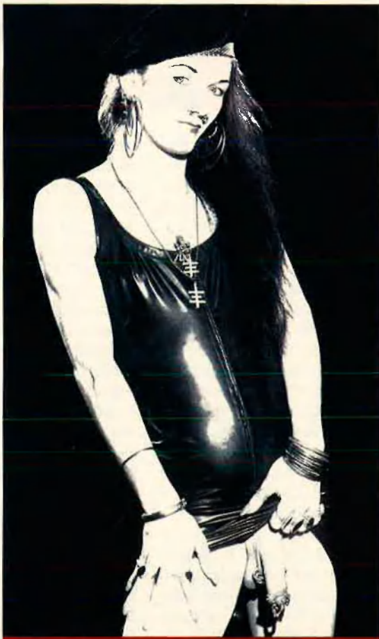
'Piercing' genital masculí. Aquestes perforacions tenen una funció estètica o sexual.

L' apadràvia és la versió horitzontal de l' ampal·lang . En parla el Kama Sutra i l'utilitzen al sud de l'Índia. La perfora-