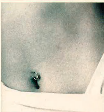
El melic és dels llocs més delicats. És una zona que s'infecta sovint.

ció pot ser a través del prepuci o pels costats. La pell del penis també es deixa perforar, cosa que ja feien els romans per impedir les relacions sexuals d'esclaus i atletes. L' hafada és la perforació a l'escrot –tantes argolles com el client vulgui– a títol de decoració. En alguns països àrabs es perforen la part dreta de l'escrot com a signe d'adultesa.