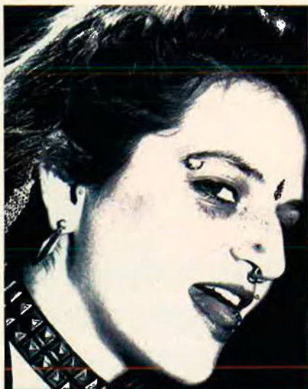
La cara ofereix moltes possibilitats. La joieria pot ser diversa.