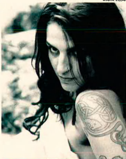
'Piercing' al nas. Després de les orelles, és on més forats es fan.