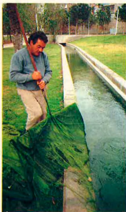
Un jardiner del Vetges-tu. Neteja un munt fantasmal d'algues.