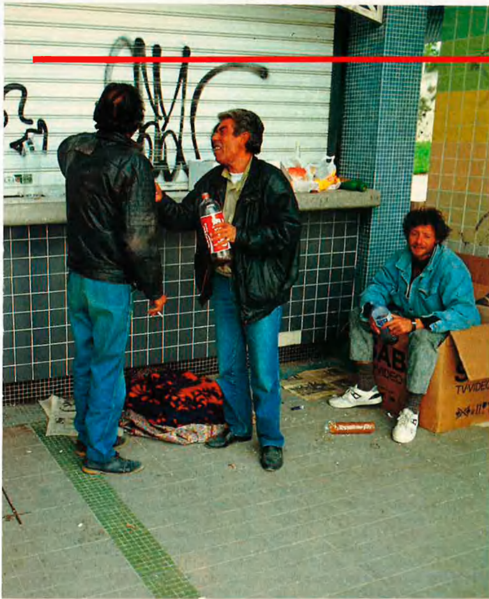
Al llit del riu Túria manen els contrastes. Els vagabunds de la foto gran, els estudiants que prenen el sol a l'esquerra, els barraquistes de baix, i el xic fent skate-board de la tercera són part de la seua fauna diària.

ser possible, per un seguit de controvèrsies polítiques, i en acabat cada jerarca del consistori va imposar el seu propi programa d'urbanització, i el llit ha quedat en un trencaclosques de formes vinculadisses que tenen poc a veure entre elles. El recorregut d'aquest cuc tortuós de 898.453 m 2 per al caminant comença al pont Nou d'Octubre, el primer que el creador dels equilibris impossibles, Santiago Calatrava, va projectar per a la ciutat, i que ara té les voltes neogòtiques prenyades d'esclètxes i brutícia. Des d'ací fins al pont de Campanar, la decoració de l'extensió va ser duta a terme per l'equip d'arquitectes Vetges-tu. Aquest tram està dominat per una mena de mesquita postnuclear, de disseny agressiu i base paral·lelepípeda, que havia de ser el punt de reunió social d'aquesta zona, segons les optimistes ambicions socialistes dels vuitanta. Ara és un búnquer fred en un estat de coma