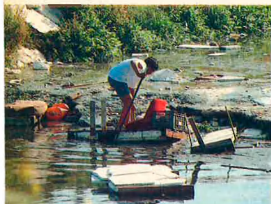
Un jove busca objectes de vàlua. És barraquista de l'últim tram del riu.