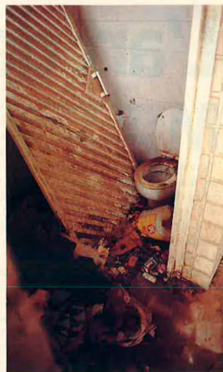
Elements del lliç. Són en completa podridura.