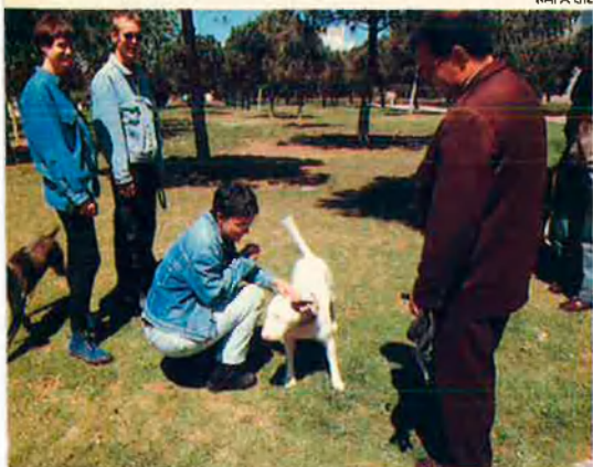
Visitants davant el Palau. Es reuneixen per mostrar el pedigree del gossos.