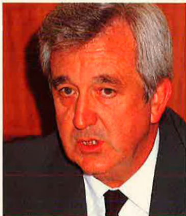
Gabriel Cañellas. El president balear ha aconseguit el suport unànime dels empresaris.

de confrontació amb el PP de difícil retorn. En aquells dies, l'oposició deia sovint que "Cañellas comença a estar erosionat i és l'inici de la seva fi". El tancament va passar i pocs mesos després ja ningú no se'n recordava. De fet en les següents eleccions, les generals, el PP obtenia el suport més gran -fins aleshores- que mai havia tingut.