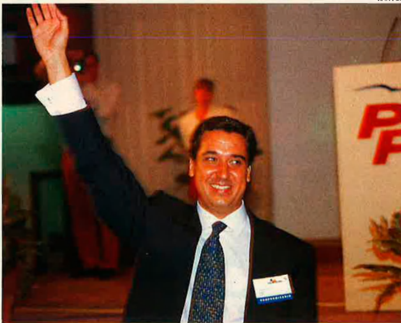
Eduardo Zaplana, candidat a president de la Generalitat. Els populars aspiren a desbancar els socialistes.