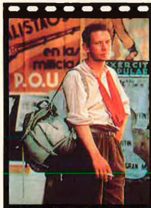
David és un personatge clau. La seva mort desencadena els records.