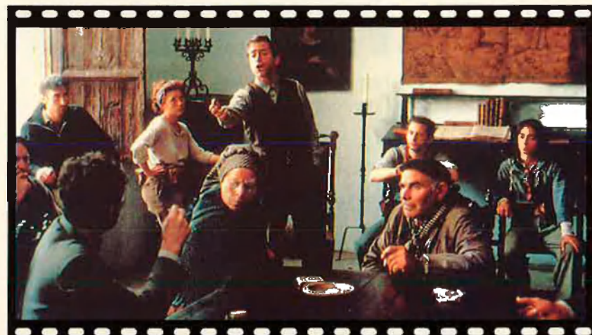
L'escena de la discussió sobre la col·lectivització (foto) és vital per al desenvolupament de la pel·lícula. El film de Loach ha generat una discussió sobre el seu rigor històric i l'evolució i desaparició del POUM.

anglès, els actors no van veure el guió fins un dia o dos abans de rodar.