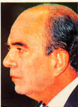
Emilio Botín. El president del Santander, vol privatitzar les pensions.

per exemple, diuen que d'aquí a l'any 2020 les despeses de protecció social augmentaran un 30% en termes reals, només a causa dels efectes d'envelliment. González Calvet, per la seva banda, opina que aquest no és un cost insuportable si l'economia creix a una mitjana de l'1% anual, que no deixa de ser una hipòtesi