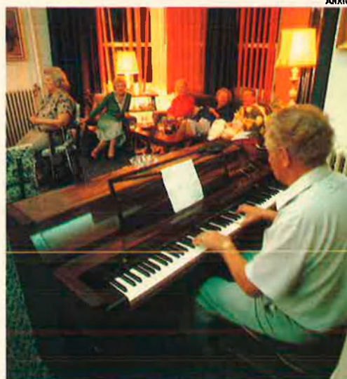
Una sessió de teràpia musical. L'origen d'aquesta pràctica és als EUA de la post-guerra.