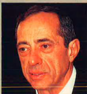
MARIO M. CUOMO

L'antecessor de Pataki com a governador de Nova York és l'abanderat dels opositors a la pena de mort i va vetar 12 projectes de llei durant els anys que fou el cap d'aquell estat nord-americà. Cuomo ha interpretat el projecte de llei com un pas enrere en el camí de "la civilitat i la intel·ligència".