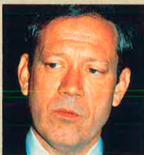
GEORGE A. PATAKI

L'actual governador republicà de l'estat de Nova York ha complert la principal promesa de la seva campanya electoral. Fa unes setmanes, va estampar la signatura en un projecte de llei que reinstaura, després de divuit anys, la pena de mort en aquest estat.