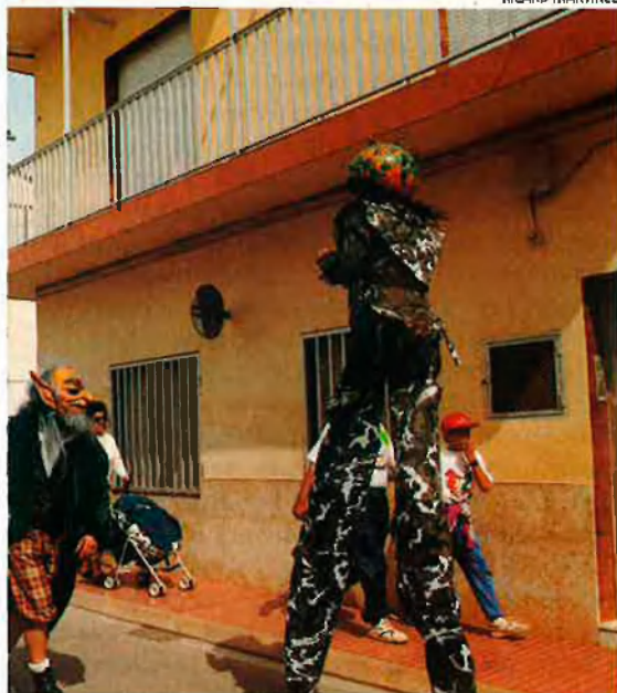
Les trobades de primavera de la FEV de l'any passat (fotos de dalt) se celebraren entre els mesos d'abril a juny. Enguany es concentraran en un cap de setmana.

més, els exàmens per a l'obtenció dels certificats de la Junta Qualificadora de Coneixements de València van superar l'any 1994 les 70.000 matrícules, i en aquests moments hi ha 31 oficines municipals de promoció de català al País Valencià. La participació de les empreses en el procés de promoció de la llengua és també una constant. L'any 1994 un total de 1.650 comerços i indústries van realitzar activitats de normalització lingüística.