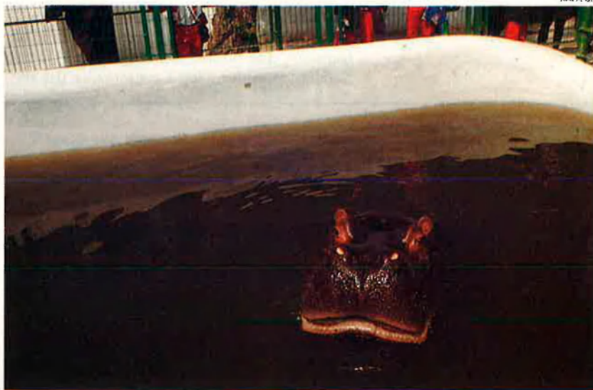
Un immens hipopòtam del mateix recinte. L'animal sobreix d'una mínima bassa d'aigües negrenques.

al 1994, per afrontar un pressupost de 73 milions de pessetes de despeses, només 6 foren aportats per les esmentades administracions. La resta, els va proporcionar la taquilla i la venda d'animals. Una taquilla que va disminuint, tenint en compte que l'any passat el zoo tingué 50.000 visitants menys (la mitjana anual era de 250.000).