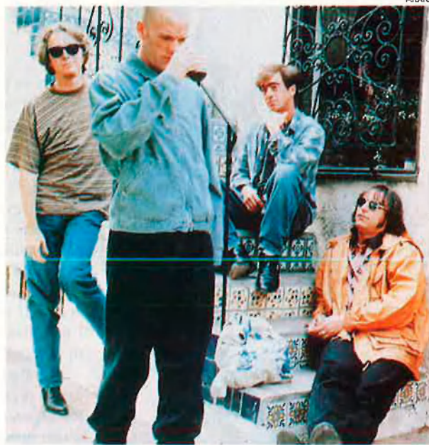
REM, un dels supervivents de la dècada dels vuitanta. Al contrari de Nirvana, la popularitat els ha arribat quan ja estaven molt bregats en el món musical.

Estètica grunge. Un cop es consolidà la marca musical grunge, aquesta denominació d'origen havia de marcar les pautes d'una nova moda. Les camises de quadres que havien portat la Creedence Clearwater Revival als 60, es tornaven desendregades en el conjunt tèxtil dels joves grunge. Amb roba de segona mà com més usada millor, el nou estil marcava la pauta de vestir desmanegat. Fins i tot dissenyadors reconeguts com Armand Bassi es van fixar en una nova manera de vestir. Evidentment des de Seattle no hi havia res premeditat, "en aquesta ciutat fa un fred terrible, i aquestes camises de franel·la a quadres són les típiques que porten sempre", explica David Talleda. Però com totes les