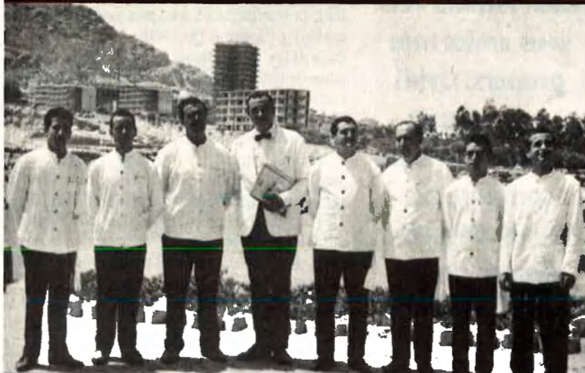
El primer per la dreta, quan treballava de cambrer, en un dels oficis que repetiria més vegades. Fins i tot en la ficció.