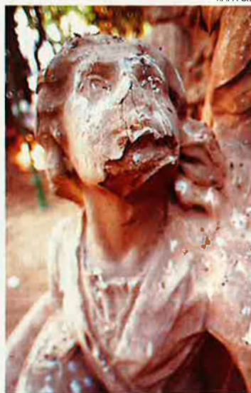
L'església de Sant Joan, dalt, amb el mal de la pedra. Una altra joia per recuperar.

utilitzar en els textos redactats en valencià. Però el CCCV va entrar en un procés de letargia després que ETA assassinara Manuel Brosseta i no va ser fins que va sorgir la idea de presentar una candidatura per a la capitalitat europea de la cultura que va tornar a ser objecte de debat. Ni els regidors socialistes ni els d'Esquerra Unida volien que un òrgan compost únicament per personalitats properes al Partit Popular i a Unió Valenciana dissenyara un projecte que podria convertir-se en el referent internacional de la ciutat.