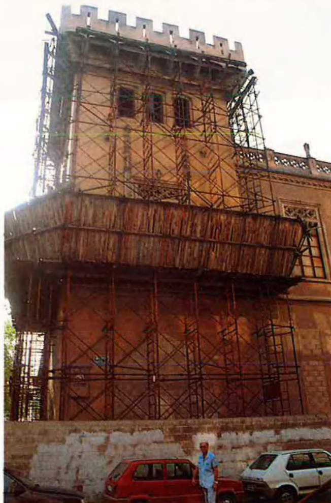
El Palau de l'Exposició, un dels pocs edificis modernistes singulars de València. Espera de fa molts anys alguna ocupació que justifique una intervenció a fons.