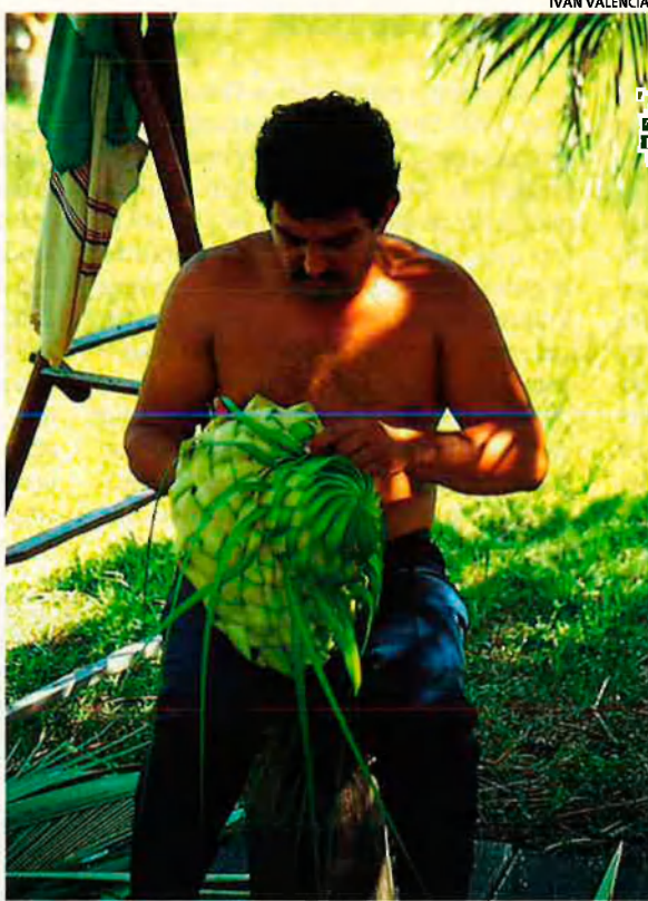
Moltes empreses dels Països Catalans s'han instal·lat a Cuba. La Llei Helms va contra elles.

de la COPCA –Consorti de Promoció Comercial de Catalunya– considera difícil que s'aprovi la llei amb tota la duresa que s'ha anunciat "perquè seria portar-la a un absurd: fins i tot els avions d'Iberia no hi podrien aterrar", però no s'acaba de refiar: "no sé fins quin punt la iniciativa de Helms pot prosperar. Helms és membre de la branca més conservadora del Partit Republicà i potser hi haurà canvis abans de ser aprovada. Ara bé, als països que tenen interessos a Cuba, una llei d'enduriment del bloqueig –tingui l'abast que tingui– els afectaria molt negativament".