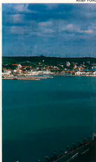
Menorca, escenari de frau. Per evasions fiscals.