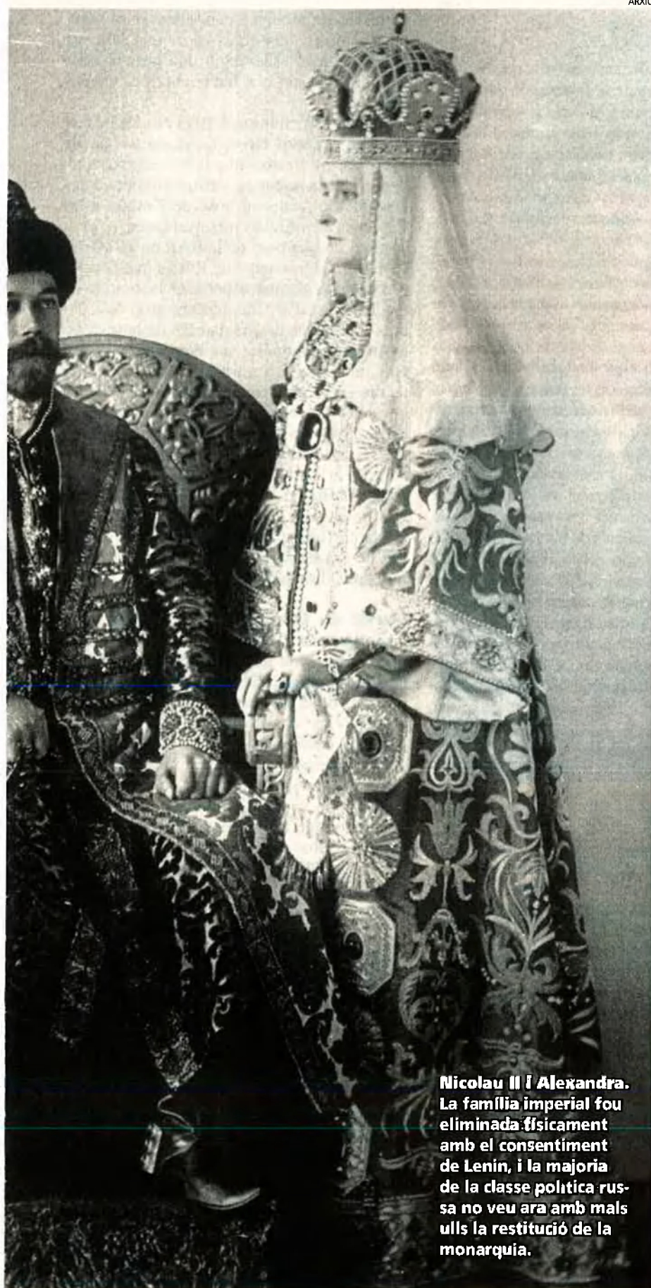
Nicolau II i Alexandra. La família imperial fou eliminada físicament amb el consentiment de Lenin, i la majoria de la classe política russa no veu ara amb mals ulls la restitució de la monarquia.

quan arriba el moment de la veritat no dubta a complir les ordres: