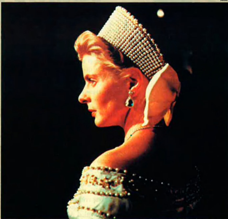
Ingrid Bergman va interpretar la versió més hollywoodiana de l'enigma d'"Anastàsia"-Anna Anderson. La dona que deia que era l'última filla del tsar.

En l'altra versió d'Anastàsia que va dirigir Anatole Litvak, amb producció nord-americana, Ingrid Bergman és a punt de tirar-se al riu. Però el riu no és un canal de Berlín, sinó el Sena, a París.