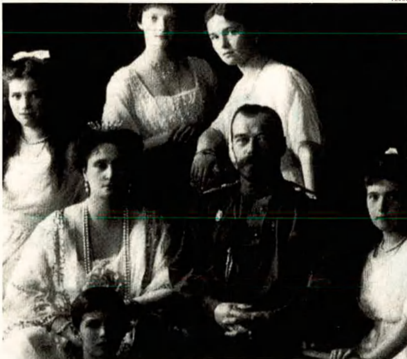
La família imperial. Darrere, les grans duquesses Maria, Olga, Tatiana i Anastàsia; davant, la tsarina Alexandra, el tsarèvitx Aleix i el tsar Nicolau II.