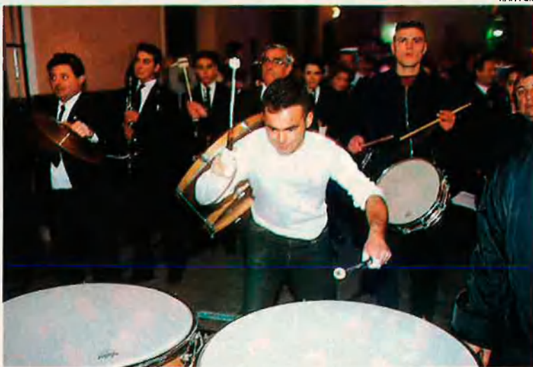
La música travessa la vila: "Tots segueixen les bandes, amb les músiques de ritme cridaner i exultant."