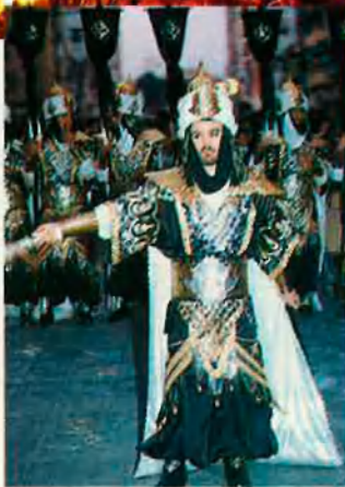
Moros aparatosos i cristians delirants. Cavalls i cavallers.

L'hivern és dur per a viure'l de nit i a la serena, ni que siga en aquesta Mediterrània nostra. Cal foc al carrer com cal foc al cos i a l'ànima per mantenir viva la nit i vetllar-la amb joia pels carrers i a la plaça fins a la vigília. I n'hi ha moltes, de maneres d'escalfar la gran nit de l'hivern en comboi. Com diu Antoni Arino al bell llibre El foc i la roda del temps és “al poble de Canals, en una de les comarques centrals valencianes, on cada hivern el foc esdevé art i joc i es repeteix inconscientment aqueix misteri que està sota el procés de la gènesi de la cultura. I així el foc també és festa”. Per això, per sentir