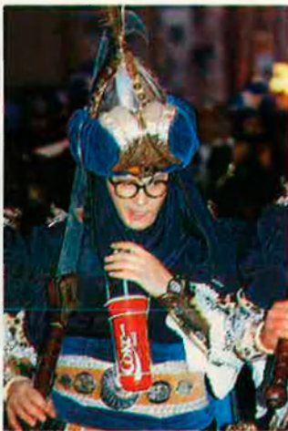
Barreja d'elements. La diversitat esdevé un conglomerat de les festes valencianes.

com cal la festa de Sant Antoni, enguany he volgut triar Canals, al cor de la Costera.