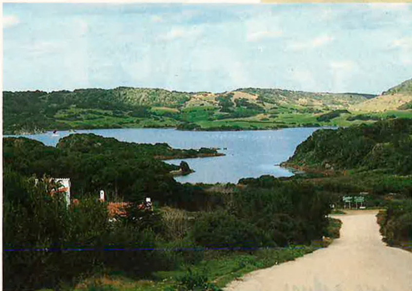
S'Albufera des Grau. Les 19 àrees naturals protegides ocupen el 40% de l'illa.