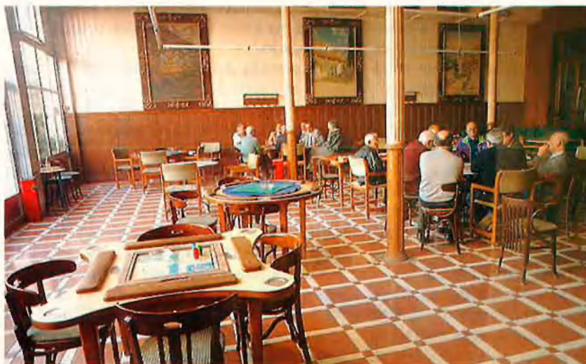
Timba matinal en els intestins del Círculo Mercantil. Un homenatge a l'economia.

Després de constituir el més clar precedent de Gernika, la ciutat va recuperar protagonisme durant el trienni liberal, en què va ser capital de província, dibuixant una jurisdicció entre el Xúquer, la serra del Benicadell i el Montgó que coincidia amb el solomillo del país, i que avui promouen alguns sectors amb el terrible nom de "comarques centrals" enfront de València. Descapitalitzada de nou, Xàtiva ha suportat terratrèmols, el francès, l'absolutista, el còlera, els carlistes i l'alçament militar del 36. El 12 de febrer del 1939, l'aviació insurrecta va bombardejar l'estació en el moment just que el tren que transportava un destacament de soldats republicans arribava. Minuts després de l'acció, els membres trossejats de les 109 víctimes penjaven sobre les rames dels plàtans de l'estació, fet que va donar pas a una pluja de plasma i coàguls que era una aproximació molt perversa a l'horror, la qual, amb el tros de crani del l'home de la Cova Negra, forma les tapes d'un sandvitx històric suculent.