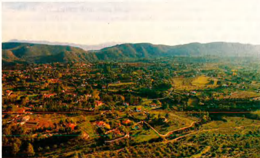
La vall de Bixquert. De secà ascètic a Suïssa en miniatura on fixen la segona residència els xativins.