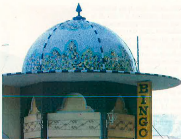
Cúpula de mosaic de l'antic bar Los Arcos. Un casc de la primera guerra mundial molt suggestiu.

El castell són dos castells. El que corona el pit de l'esquerra és el Menor. I en el Major hi ha la