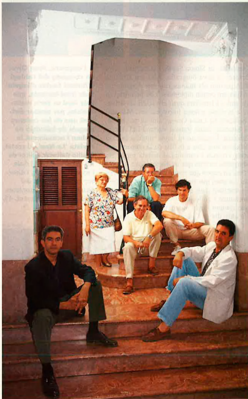
Els actors de la història. El propietari de l'immoble, que s'estimava més que marxessin els llogaters, va anar ajornant els arranjaments fins que s'hi va fer impossible la vida. La història es va acabar.