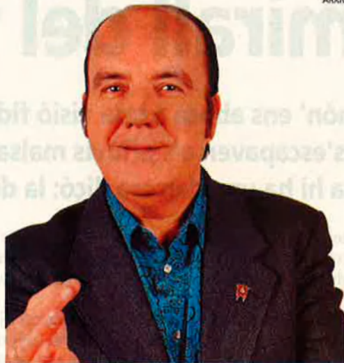
Chiquito de la Calzada.

Divendres, 30. Sembla que mai no celebrarem prou l'aparició sobtada d'un home que en qüestió de mesos ha tengut prou energia per capgirar la semàntica quotidiana, amb influència gairebé institucional. Ni Heidegger ni Lacan haurien pensat mai a influir d'una