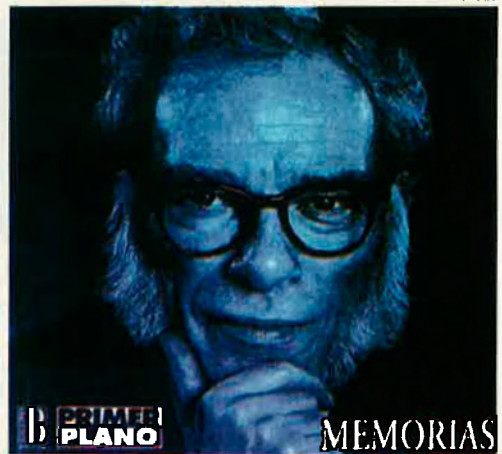
Isaac Asimov. El famós escriptor, a més de la ciència-ficció, conreà el gènere històric.

Als sis anys es demostrà preocupat per la manca de llibres a casa, deguda a causes purament econòmiques. Així, durant els quinze anys següents, la biblioteca esdevingué la seva segona llar i llegí indiscriminadament una gran quantitat de llibres, sobretot de tema científic. Aquest fet contribuï euficament a la seva brillant trajectòria d'escriptor. El primer contacte amb la ciència-ficció, el tingué llegint revistes d'aquest gènere que venia un quiosc a tocar la botiga de caramels de son pare. Veient que només hi havia tres revistes de caràcter mensual, als onze anys decidí d'escriure relats de ciència-ficció pel seu compte. Segons paraules d'ell mateix, no és fins als quinze que començà a escriure autèntica ciència-ficció. Als divuit, la famosa revista Astounding Science Fiction , que editava John Campbell Jr, un dels màxims impulsors del gènere i un dels qui l'anima i l'orientà amb més ímpetu, li publica el primer conte, "Marooned off Vesta" ("Abandonats prop de Vesta"). És en aquest moment que s'adona que la seva carrera d'escriptor havia començat.