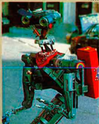
La robòtica inspirava Asimov. En té moltes obres.

criure. En aquests primers catorze anys només treballa en el camp de la ciència-ficció, però en els vint anys següents es dedicarà bàsicament a escriure textos de no-ficció que pràcticament tocaven totes les branques científiques: física, química, matemàtica, botànica, genètica, astronomia i astrofísica. També en aquesta època, publica un parell de novel·les i desenes de contes curts de ciència-ficció.