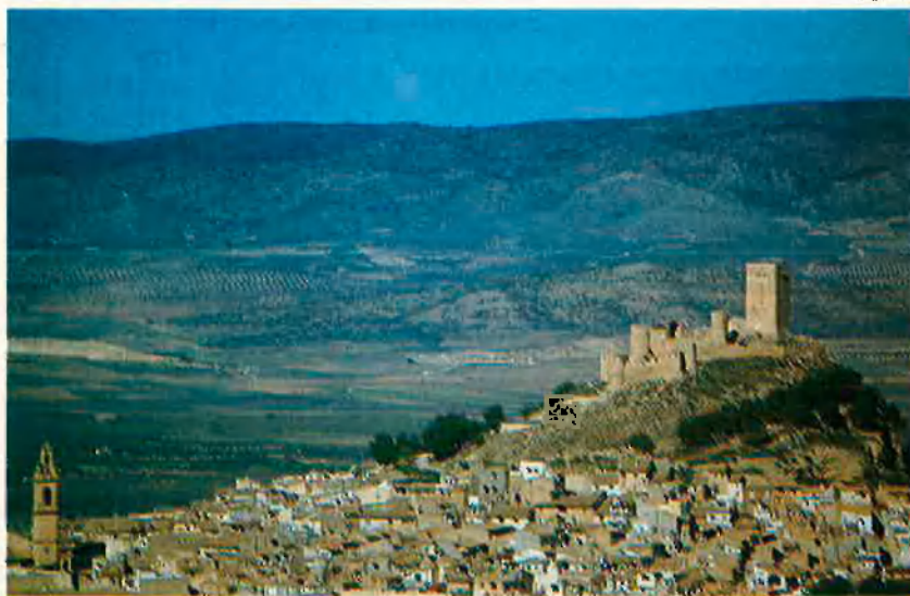
El castell de Biar: “Biar impressiona de lluny amb el seu castell ben conservat que ens diu clarament la condició de frontera de la vila durant segles.”