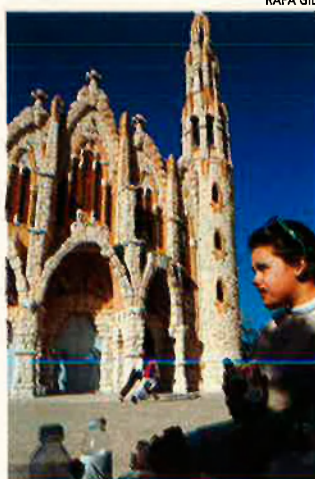
El santuari de la Magdalena de Novelda: “Ben curiosa de veure és l'església que hi ha, amb el seu modernisme gaudinià, encara avui punt de peregrinacions, d'excursions escolars, d'encontres amorosos...”

Els castells de Mondóver i Novelda ja no tenen l'elegància dels anteriors i només en resten uns pocs elements de terra cremada, murs que només la fantasia recrea per convertir-los a imatge de les alcassabes de l'Atlas, murs que l'abandó i l'oblit torna a fer terra i acaben per desaparèixer definitivament. El castell de Novelda, ano-