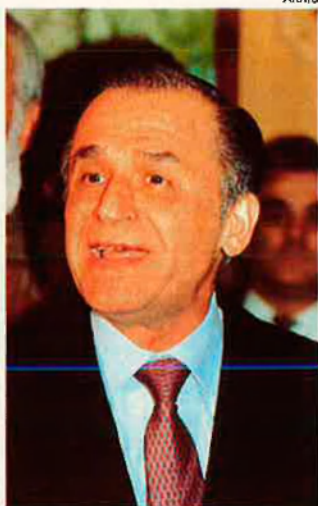
Ion Iliescu, president de Romania. Els appàrtxiki que van fer fora i van afusellar els Ceausescu el dia de Nadal de 1989 no volen, ni poden, ni saben treure Romania del túnel, i per això han de recórrer als perills interns-externs per explicar-se.

Amor i ètnia. Transsilvània es dibuixa com la regió ètnicament més perillosa d'Europa, després de la guerra de Bòsnia. Només la derrota d'Iliescu i dels seus aliats i l'arribada al poder de l'oposició liberal i democristiana apaivagaria els ànims. Probablement se signarien els acords bilaterals entre Hongria i Romania —que preveuen el respecte a les minories—, es frenaria la involució “nacional-comunista” antihongaresa que promou Bucarest i es podrien abordar tímidament qüestions de descentralització administrativa. Però la continuïtat del règim d'Iliescu pot trencar, a termini mitjà, els precaris vincles econòmics amb