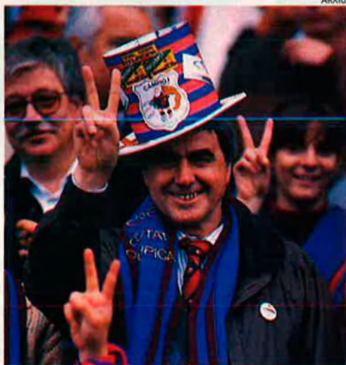
Un club anomenat Barça.

“Hem convertit el Barça en un contenidor on aboquem el nostre rebentisme més discordat quan perd i el nostre sentimentalisme més carrincló quan guanya”.