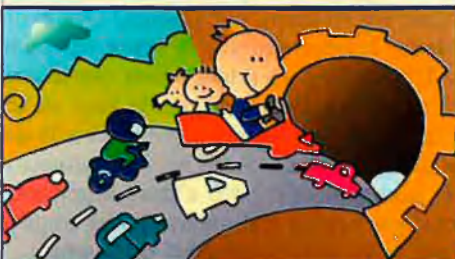
Túnel del Cadí: participació 53%