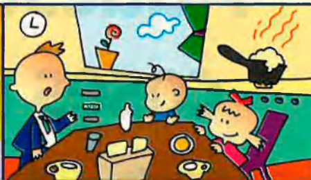
Gas Natural: participació 25%