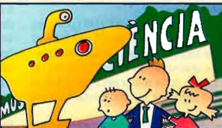
Museu de la Ciència: 100% Fundació Caixa