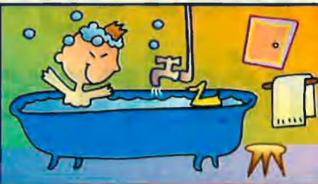
Aigües de Barcelona: participació 25%