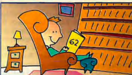
Edicions 62: participació 24,5%