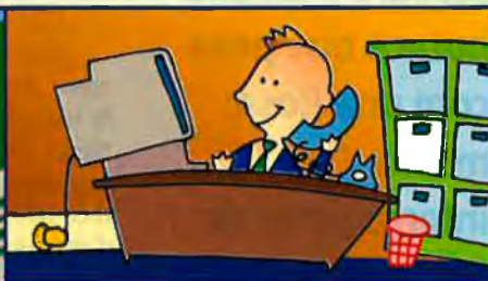
Telefònica: participació 1,37%

país s'acosten a "La Caixa". La capacitat de despesa de l'entitat financera i la seva xarxa d'oficines en tot el territori del Principat fan que siguin diversos els departaments de la Generalitat de Catalunya que tenen algun conveni o acord de col·laboració amb l'entitat. És el cas, per exemple, de les conselleries de Treball (des del mes de febrer qualsevol empresa o treballador parat podrà consultar a través de les terminals Servi-Caixa una extensa base de dades d'oferta i demanda de feina elaborada per la Conselleria); Ensenyament (tots els instituts públics i privats de Catalunya oferiran als seus alumnes un programa multimèdia d'informació sobre la sida elaborat per la Fundació "La Caixa"); Sanitat (la