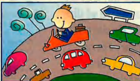
ACESA (autopistes): participació 43%

Un ciutadà mitjà de Catalunya està continuament en contacte amb 'La Caixa', encara que no en sigui client directe. EL TEMPS ha reconstruït un itinerari possible a través de deu de les societats participades per l'entitat financera. A diferència dels bancs, 'La Caixa' només inverteix en empreses de serveis -no industrials-, sovint estratègiques. Són inversions poc arriscades, rendibles a llarg termini. Altres societats participades per 'La Caixa' són: Banc d'Europa (75%), CaixaBank (100%), Aucat-Autopistes de Catalunya, SA (25%), Vaqueira Beret (11,7%), VidaCaixa-assurances (60%), Banesto (1,4%), entre d'altres. En total, la inversió és de 331.000 milions de ptes., que donen uns dividends d'uns 20.000 milions cada any.