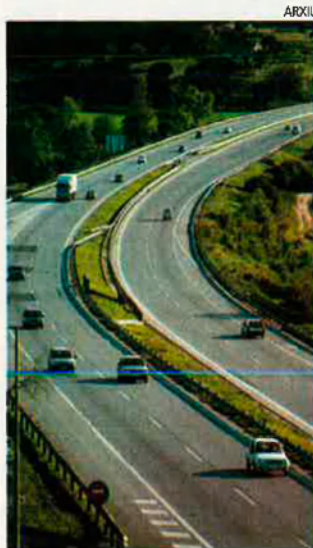
Un tram de les autopistes d'ACESA, societat participada per "La Caixa". L'entitat financera inverteix prioritàriament en empreses d'infraestructures o de serveis.

Els tentacles de "La Caixa" no s'han estès al món estrictament industrial. A diferència dels bancs tradicionals, que controlen directament la gestió de grans corporacions industrials, "La Caixa" ha defugit voluntàriament tota inversió d'aquest tipus, considerada "massa arriscada". De fet, per a molts bancs la cartera industrial s'ha convertit en un dels principals problemes de