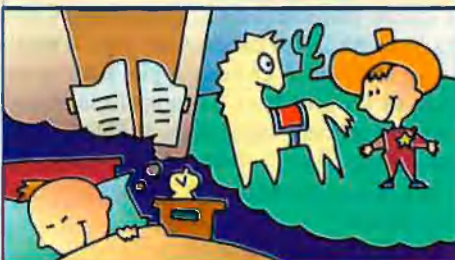
Port Aventura: participació 30%

Un ciutadà mitjà de Catalunya està continuament en contacte amb 'La Caixa', encara que no en sigui client directe. EL TEMPS ha reconstruït un itinerari possible a través de deu de les societats participades per l'entitat financera. A diferència dels bancs, 'La Caixa' només inverteix en empreses de serveis -no industrials-, sovint estratègiques. Són inversions poc arriscades, rendibles a llarg termini. Altres societats participades per 'La Caixa' són: Banc d'Europa (75%), CaixaBank (100%), Aucat-Autopistes de Catalunya, SA (25%), Vaqueira Beret (11,7%), VidaCaixa-assurances (60%), Banesto (1,4%), entre d'altres. En total, la inversió és de 331.000 milions de ptes., que donen uns dividends d'uns 20.000 milions cada any.