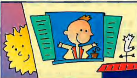
INCOSA (Immobiliària): participació 99%