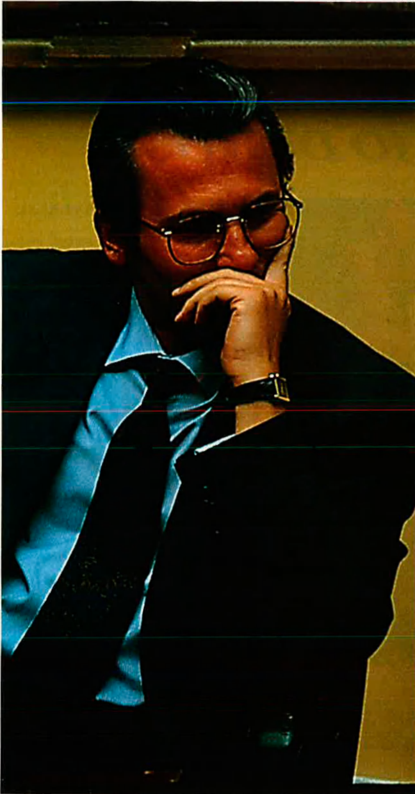
Baltasar Garzón. El jutge ha despertat les ires dels seus antics companys socialistes amb la seua voluntat de tancar el "cas GAL".

La implicació del Govern espanyol en la trama dels GAL es fa encara més evident amb les noves declaracions d'Amedo i Domínguez.