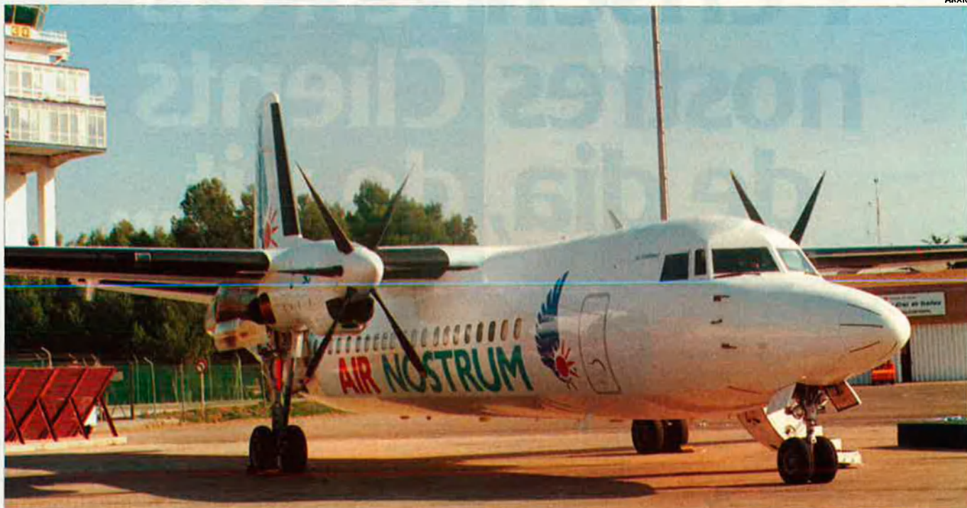
Avió de la companyia Air Nostrum. La primera flota aèria valenciana compta amb tres aparells de facturació alemanya: una fita històrica, una aventura arriscada.