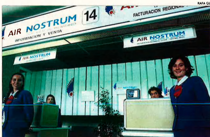
Tauell de facturació d'Air Nostrum a l'aeroport de Manises. La companyia disposa d'una plantilla de dues-centes persones i espera aconseguir beneficis cap a l'any 1996.