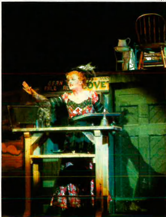
Angela Lansbury, en 'Sweeney Todd'. Un thriller musical d'Stephen Sondheim que es podrà veure dins de la programació del Centre Dramàtic de la Generalitat de Catalunya.