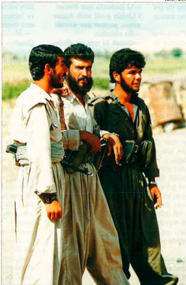
El PKK té entre 15.000 i 30.000 homes. Al 1984 comptava únicament amb uns centenars de guerrillers.

A conseqüència de la manca de mà d'obra barata a la RFA, durant els anys 60 —època de gran creixement econòmic—, centenars de milers de ciutadans turcs hi emigraren a fi d'ocupar llocs de treball de