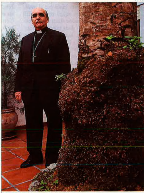
El bisbe de Mallorca va tenir una relació molt estreta amb Tarancón: "Distingia a tots els valencians amb un afecte especial."

ment espanyol. Lamentablement, s'han de morir les persones perquè se'ls reconeguen els mèrits.