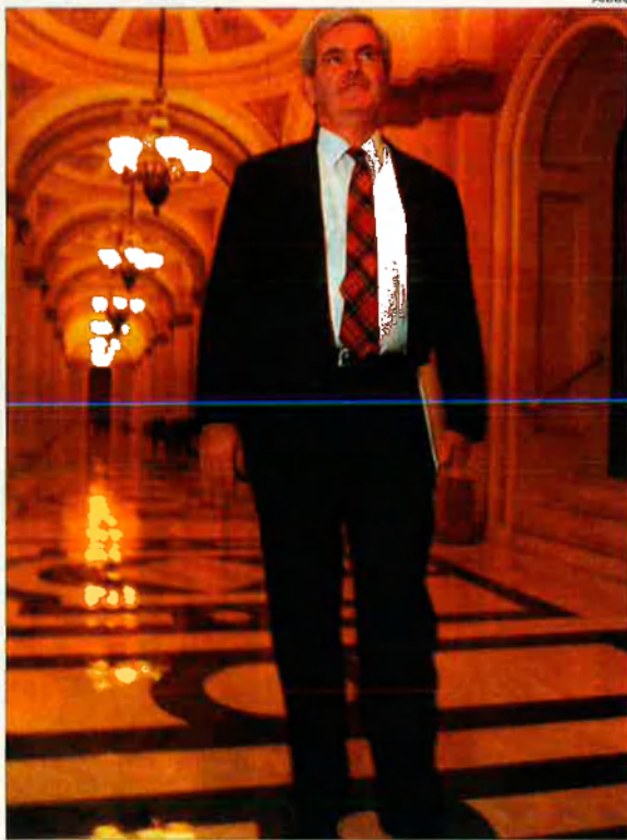
Newt Gingrich. El dirigent radical republicà és, per a l'historiador Arthur Schlesinger, un matusser que es troba en un estat d'eufòria maníaca.

d'això. Què hauria de fer per tornar a revifar la seva presidència?