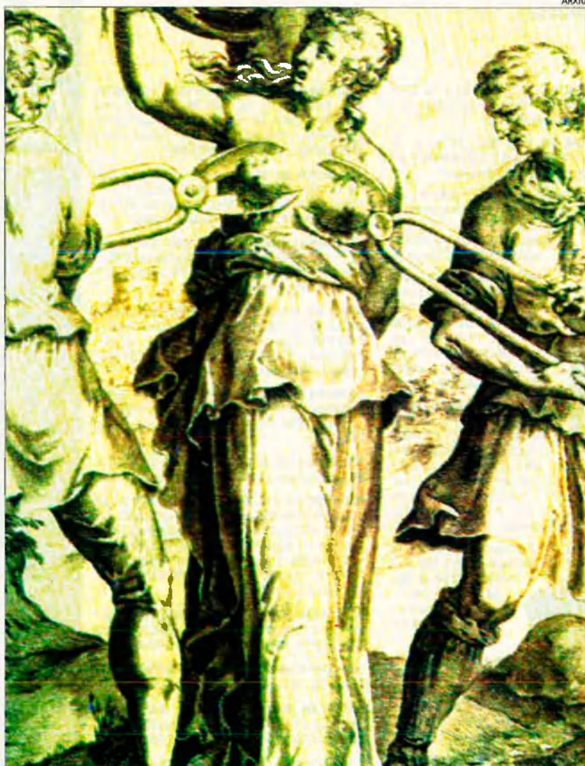
Santa Àgueda fou martiritzada per defensar la seua castedat. El moviment pro-abstencionista dels EUA va tenir el seu origen en un institut de Baltimore on un grup de joves verges i de xiques penedides dels seus primers contactes eròtics van constituir el club "Abstinence Girls".