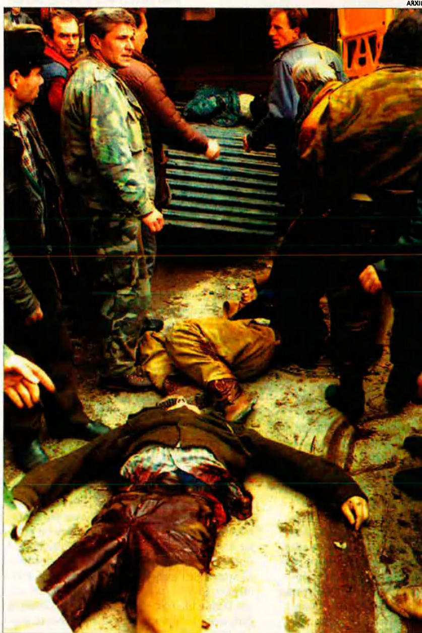
Cadàvers als carrers de Sarajevo. El degotís de víctimes civils a la guerra de Bòsnia no s'atura.

Aquest cap de setmana les forces sèrbies assetjaven Bihac, Sarajevo i altres punts de Bòsnia, com a resposta a l'ofensiva de l'exèrcit governamental. Des de Sarajevo, Joan Solés analitza la situació militar de la zona, que canvia per hores.