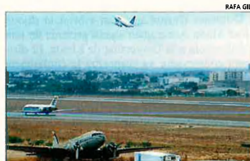
Les principals ciutats del país, unides per avió. A principi del mes de desembre.

Precisament Air Nostrum és una de les companyies que vol convertir-se en proveïdora del gran pont aeri que haurà d'unir les ciutats que integren el grup C-6. Aquesta àrea representa 16 milions d'habitants i és una de les de més creixement de la Unió Europea. Amb Air Nostrum competiran cinc companyies establertes en l'estat francès.