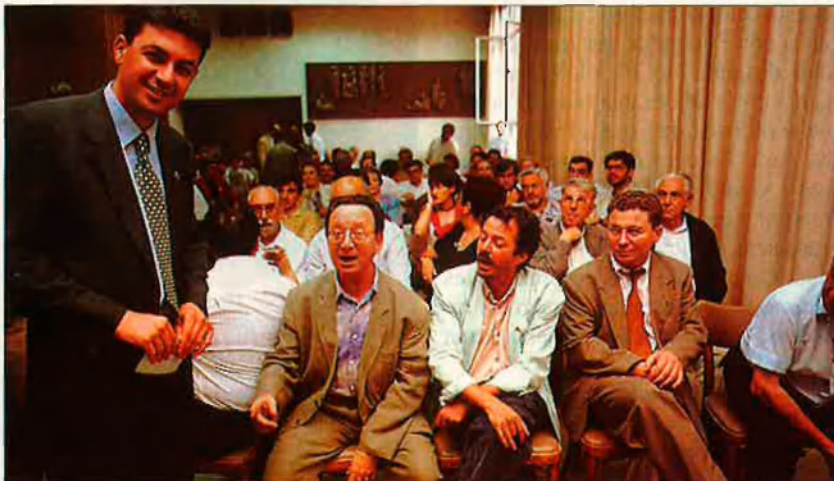
La renovació del partit és volguda. Intel·lectuals amb la UPV durant la campanya de les eleccions al Parlament Europeu del passat 12 de juny.

responsabilitat? Nostra, no; sinó que és d'aquella gent que en el seu dia va establir la clàusula del 5%. I ara resulta que per un, dos o tres escons pot canviar la majoria. Que cadascú carregue amb la seua responsabilitat. Amb tot i això, les direccions de totes les forces polítiques de progrés d'aquest país hauríem de dialogar i buscar solucions. Jo ja sé que això és complicat, perquè, entre altres coses, nosaltres no acceptarem les ofertes d'opes hostils i d'absorcions que ataquen el nostre projecte de vertebració del nacionalisme polític. En aquest país sembla que hi ha mànega ampla perquè el nacionalisme pugua actuar en el terreny cultural, però no és així quan passem al terreny de la vertebració política. I aquest és el gran repte de la UPV i per això estem disposats a fer el que calga sempre que no ataquem ni vulnere el nostre projecte.