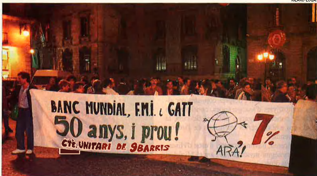
Manifestació a la Plaça de Sant Jaume de Barcelona. El 0,7% ha mobilitzat força gent.

MOBILITZACIONS PER ACONSEGUIR QUE ELS GOVERNOS AJUDEN MÉS EL TERCER MÓN