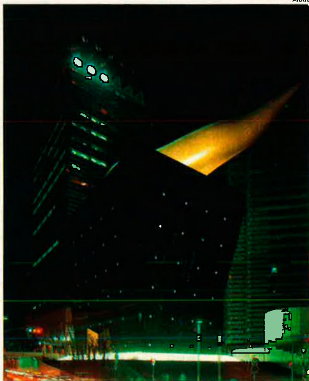
La Flama, edifici per a Asahi, Tòquio. El sòcol, de vidre lluminiscent, simbolitza l'energia; l'urna, de granit negre, el misteri; la flama, xapada en or mat, la passió.