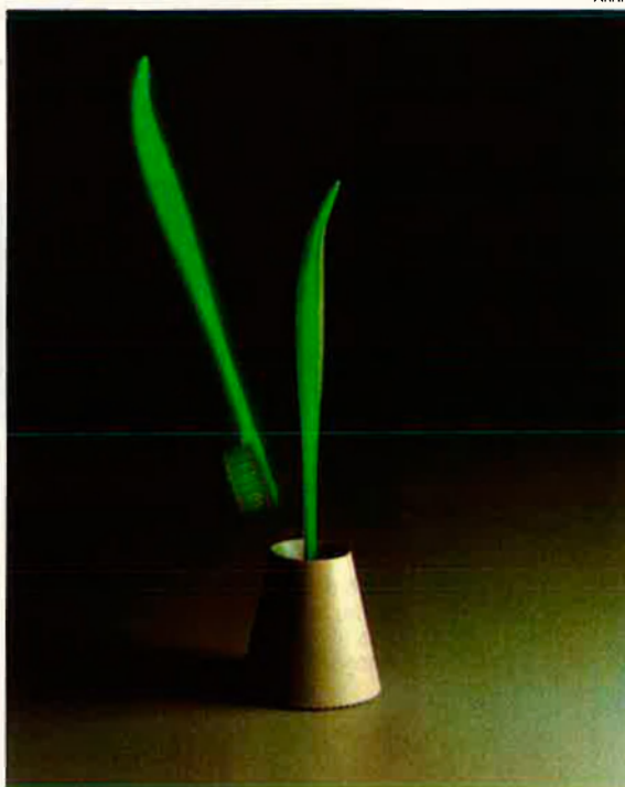
Raspall de dents. "Quan va sortir, la gent se'ls regalava a centenars".

coses ben fetes, que guanyi diners; no cal un mercat artificial.