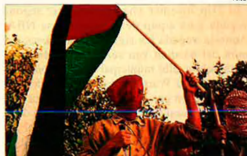
Problemes a l'OAP. Hamas els causa.

El procés de pau a l'Orient Mitjà travessa una situació delicada després del segrest d'un soldat israelià per part de Hamas i de la comissió de dues massacres per aquest mateix grup fonamentalista. Hamas és el més actiu dels grups islàmics palestins. Va ser fundat el 1987, però els seus dirigents són actius en el moviment des de principis de la dècada dels setanta. La intifada els va permetre superar la popularitat de l'OAP, en bona part per causa de la misèria i superpoblació de la franja de Gaza.