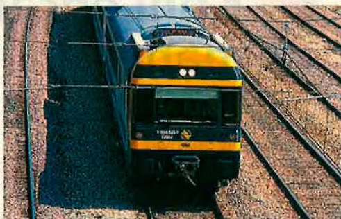
El tren València-Barcelona. No baixarà de les tres hores abans de l'any 1999.

•Renfe estudia tornar els diners en la ruta València-Madrid si hi ha retards superiors als 15 minuts.