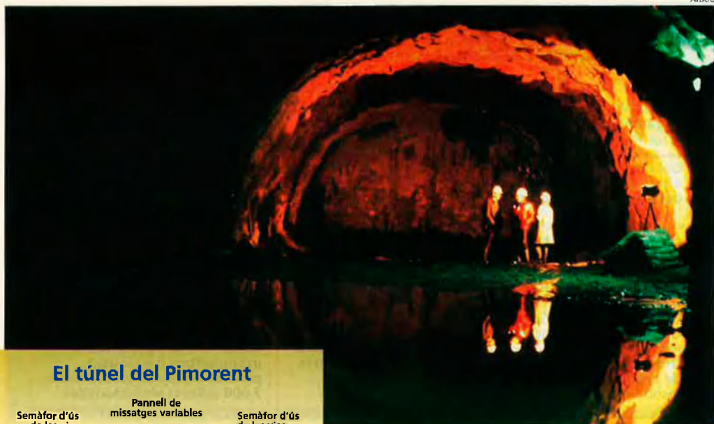
El túnel del Pimorent