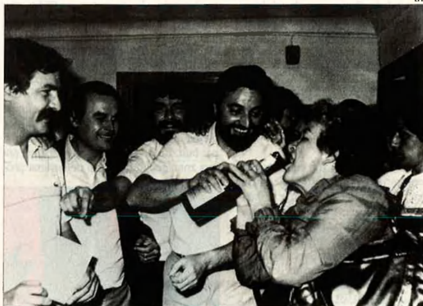
Julio Anguita celebra la seva reelecció com a alcalde de Còrdova al maig del 83. La línia ascendent cap a l'estrellat ja no tenia aturador.