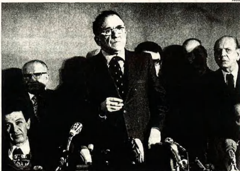
Santiago Carrillo -en la foto durant la cimera euromunista de 1977 al costat d'Enrico Berlinguer i George Marchais-, amb el seu llarg regnat incontestable al capdavant del comunisme espanyol, va sotmetre el PSUC a la seva estratègia personalista. Una submissió que Rafael Ribó i IC han pogut liquidar malgrat les reticències d'Anguita.

Terror europeu. “Escriure sobre federalisme avui vol dir posar en qüestió el model d'es-