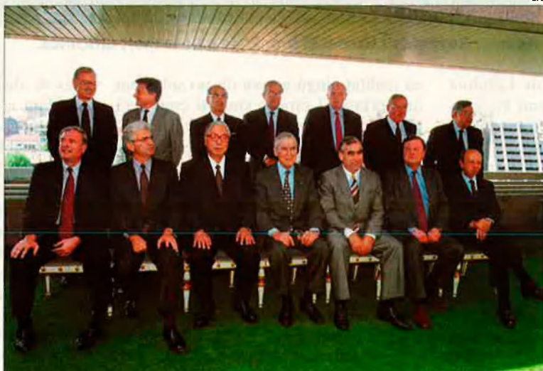
Els ministres del G-7. Els recursos financers s'han de repartir.

Itàlia qui decideix la política d'aquelles dues institucions, en reunions paral·leles en què prenen acords sobre la seva posició en l'assemblea general, oposant-se, per exemple, obertament a la proposta del FMI, que té el suport dels països pobres, d'emetre 36.000 milions de degs (de drets especials de gir) per ampliar les possibilitats creditícies del FMI.