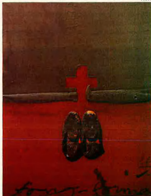
'Fang i forma'. Tàpies ha estat qualificat de "creador històric".