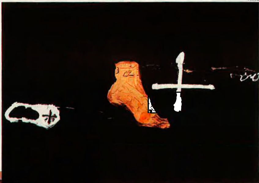
A l'esquerra, Antoni Tàpies. Dalt, Peu i creu , una de les seves obres més rellevants.

llenguatge simbòlic. En aquest sentit, s'han evitat els treballs del període influït pel surrealisme, per considerar-se que en aquest camp no va ser un innovador.