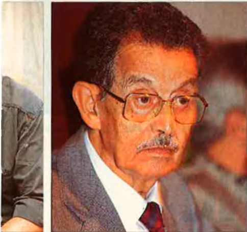
r. El manifest va adreçat a l'opinió pública.

nostra, de liberalisme i de tolerància, de civisme, d'obertura a la modernitat, i del millor valencianisme cultural i polític. Aquest projecte global –sobretot a partir de l'aconseguint de l'autonomia– ha estat el centre de totes les aspiracions de la societat valenciana, i ha servit de guia i d'horitzó als aspectes més positius de l'acció de govern i a l'actuació de tantes institucions públiques i privades, des de les universitats fins a les forces sindicals o a moltíssimes entitats cíviqes i culturals.”