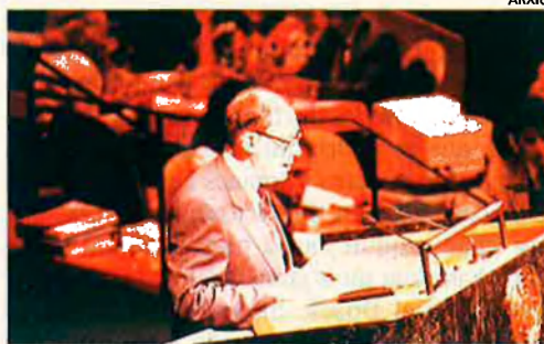
El cap de Govern andorrà. Va defensar el paper dels petits estats.

•El cap de Govern andorrà, Òscar Ribas, intervingué la setmana passada davant l'assemblea general de l'ONU, on defensà el paper dels petits estats.