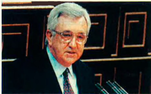
Gabriel Canellas. El president va usar un to molt triomfalista en el seu discurs.

El debat sobre l'estat de la comunitat autònoma balear no ha aportat novetats. Però ha confirmat l'eixida de la llarga cursa electoral que portarà al maig del 95. El president Cañellas, amb un to marcadament triomfalista, va assegurar que gràcies al seu govern "les Balears són la comunitat més rica d'Espanya". En el torn de rèpliques als portaveus dels grups de l'oposició el president balear no es va mostrar tan contundent i resolutiu com en ocasions anteriors, però, tot i això, no va donar peu a les crítiques i es va permetre d'ignorar les acusacions derivades dels escàndols Brokerval i Sòller.